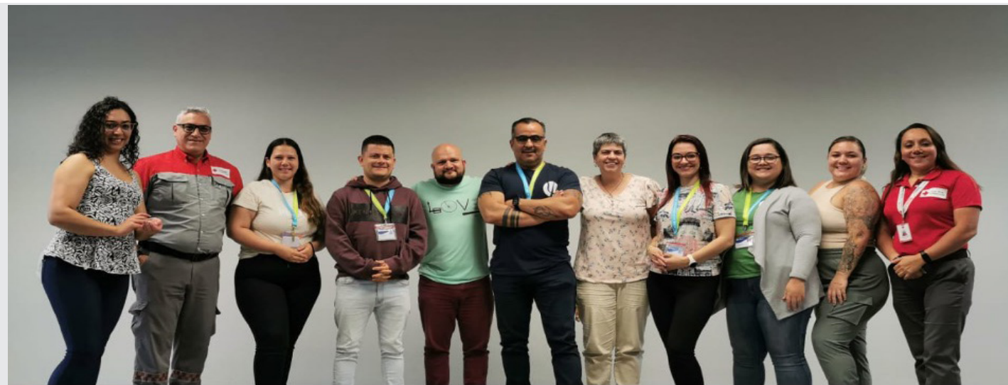
Imagen 1. Capacitación Taller de Primeros Auxilios Comunitarios, facilitada por la Cruz Roja Costarricense.