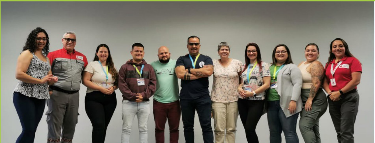
En la foto: Brigada de Respuesta a Emergencias del CPPCR, en capacitación con Cruz Roja Costarricense

La Brigada de Respuesta a Emergencias del CPPCR del Colegio de Profesionales en Psicología de Costa Rica (en adelante BRE), es una comisión interna conformada por colaboradores que bajo el principio de voluntariedad, asumen el gran compromiso de implementar procesos vinculados a una efectiva gestión del riesgo, salud, seguridad ocupacional y ambiente, con el fin de garantizar la seguridad de las personas funcionarias, colegiadas y visitantes en general en caso de situaciones de emergencia, buscando mitigar el impacto que ante un siniestro afecte a las personas, bienes o servicios y además buscando promover conciencia y cultura en la organización en temas de prevención y gestión del riesgo.