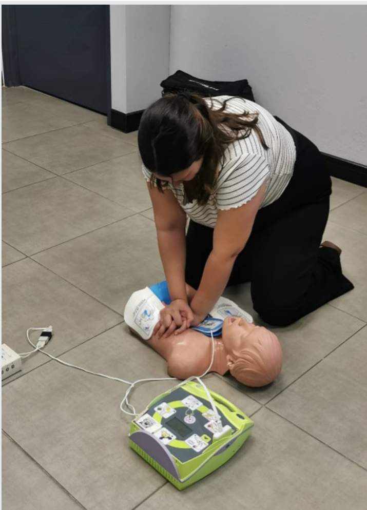
Imagen 3. Capacitación Uso del DEA, facilitada por PS Industrial en coordinación con la Cruz Roja Costarricense.