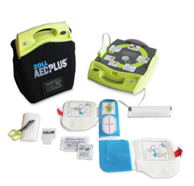
Imagen 4. Desfibrilador Automático DEA (imágenes con fines ilustrativos)

Finalmente, el equipo de brigadistas registró durante este 2024 la salida de tres personas, sin embargo, en la misma proporción se integraron personas nuevas, quedando la brigada conformada por nueve participantes en total.