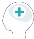
Sistemas y Servicios de Salud Mental