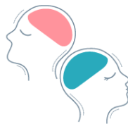
Socio-económicos y culturales