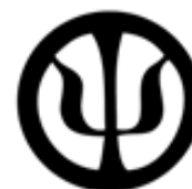
Colegio de Psicólogos de Honduras