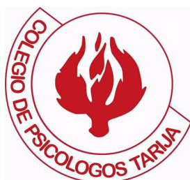
Colegio de Psicólogos de Tarija