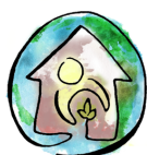
Associação Brasileira de Psicologia Ambiental e Relações Pessoa-Ambiente