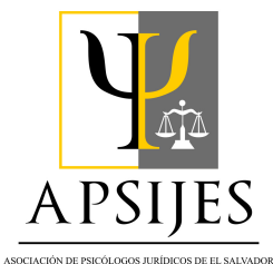
Asociación de Psicólogos Jurídicos de El Salvador