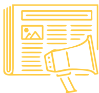
IMAGEN Y PROYECCIÓN SOCIAL DEL CPPCR